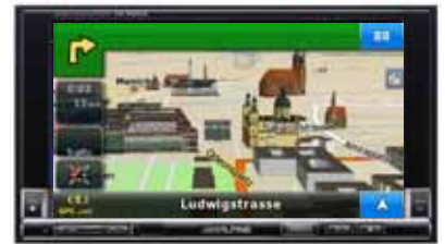
IVA-W205R, W202R W200R